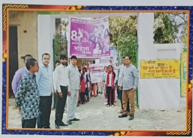
सप्त दिवसीय विशेष शिविर जागरुकता रैली में सहमागी स्वयंसेवक एवं स्वयंसेविकाएं।