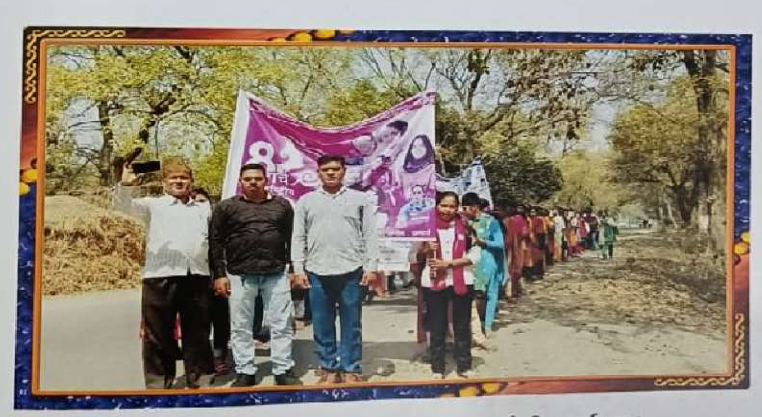
ग्राम गरुआ, मकसूदपुर में जागरुकता रैली कार्यक्रम।